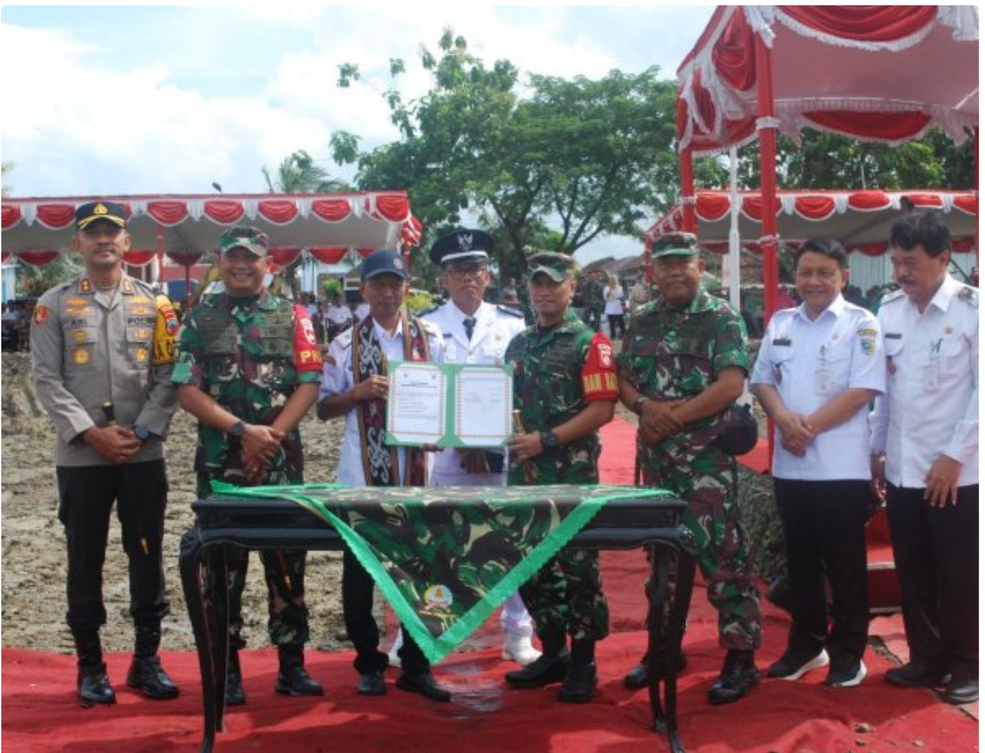
Komando Distrik Militer (Kodim) 0716/Demak menggelar upacara pembukaan TNI Manunggal Membangun Desa (TMMD) Reguler ke-123 Tahun 2025

DEMAK - Komando Distrik Militer (Kodim) 0716/Demak menggelar upacara pembukaan TNI Manunggal Membangun Desa (TMMD) Reguler ke-123 Tahun